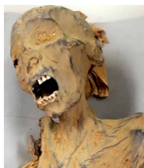
2: Múmia egípcia (3 mil anos) 3: Charge de Jota A (2019)

1: Lei Áurea : “Art. 1.º - É declarada extinta a escravidão no Brasil. // Art. 2.º - Revogam-se as disposições em contrário. 13 de maio de 1888”. (MAIOR, A. Souto, 1968, p. 338.)