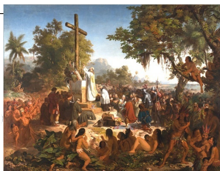
4: Primeira missa no Brasil (1860).