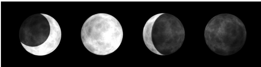
As quatro fases da

Não sendo uma estrela, a Lua não emite luz própria. Entretanto, a vemos iluminada pois ela reflete a luz proveniente do Sol.