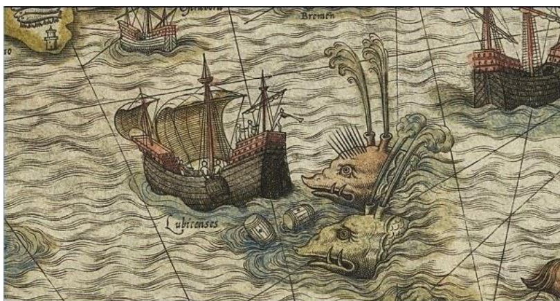
Imagem 1 - Monstros marinhos